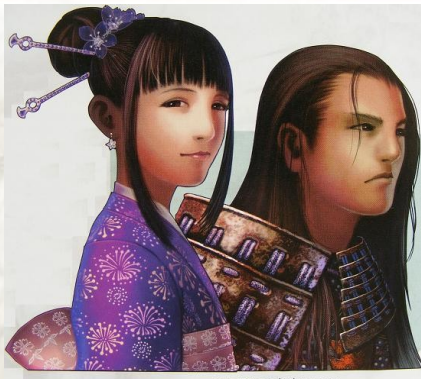
Lannetiens de l'ethnie ryuan