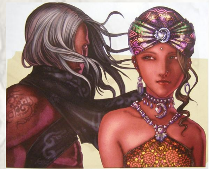
Kushistaniens de l'ethnie tayahar

Le peuple tayahar est constitué en majorité de gens qui vivent sur les terres d'Al Enneth, bien que nombre d'entre eux se soient installés jusque dans des régions éloignées, comme le Dwänhoff. Leur caractéristique raciale la plus appréciée est la couleur de leur peau, légèrement sombre et brunie comme le métal. Généralement, leurs cheveux ont une couleur terne, le châtain et le noir étant les plus habituelles. Leurs yeux peuvent avoir n'importe quelle couleur, même dans les tons clairs. On les croit originaires des zones désertiques du kushistan et du Salazar, bien qu'il soit impossible de déterminer leurs racines exactes.