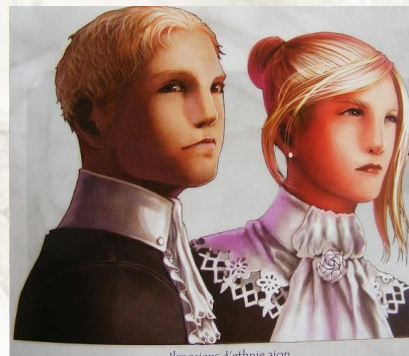
Ilmoriens d'ethnie aïon