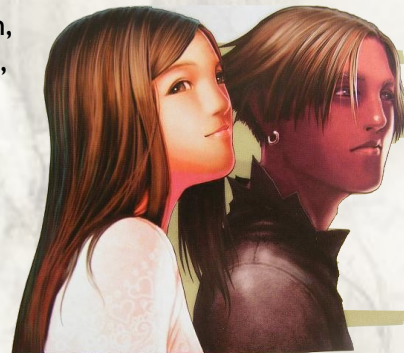
Dalliens d'ethnie asher

On appelle asher le principal groupe ethnique des secteurs centraux du Vieux Continent. Physiquement, ils se caractérisent par une constitution svelte, des traits bien faits et des yeux marons ou gris. Ils peuvent avoir n'importe quelle couleur de cheveux, mais les tons sobres, comme le brun ou le châtain, sont les plus habituels. On pourrait dire qu'il s'agit des habitants originaux de la partie centrale de Gaïa, bien qu'ils soient installés dans d'autres lieux plus lointains. Il est impossible de fixer leurs origines, car dès l'époque des Royaumes Saints ce furent les habitants les plus communs et les plus répandus.