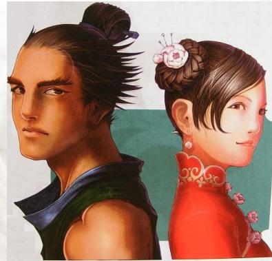
Shivatens de l'ethnie ryuan

Egalement connu comme peuple de Varja, ils occupent principalement les îles orientales, bien qu'il y en ai aussi un groupe nombreux vivant au Phaïon Eien Seimon. Ils se caractérisent par leurs yeux en amande, leurs peau légèrement dorée et leurs cheveux, toujours de couleur noire. Ils ont tendance à être de petite taille et ne sont généralement pas non plus très corpulents. Les racines des Ryuans se trouvent chez les natifs de Varja qui, durant plusieurs milliers d'années, vécurent sur l'île en ayant des contacts mineurs avec d'autres peuples. On peut donc affirmer qu'il s'agit d'une des ethnies qui sont restées les moins altérées au fil de l'histoire.